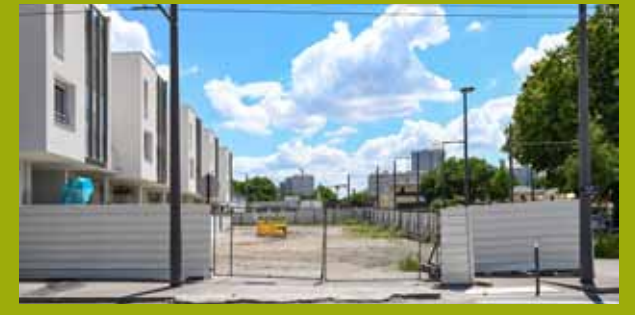
Superficie de la zone de concertation : 1000m 2